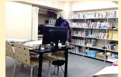
応接スペースを区切る前。