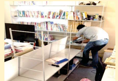
DIYで棚の移動と組み立て。