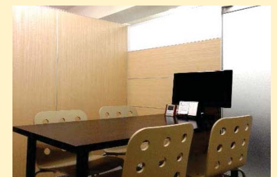
パーティションで仕切って、完成！