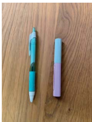
↑写真右がツイッギー ポーチサイズ。左のボールペンより一回り小さいです。

デザインもおしゃれで持っ ているだけでテンションが上 がる商品です。レギュラー商品 はホワイト、ブルー、ピンクの 3色展開ですが、数量限定で 限定カラーの商品が販売され ることもあります。写真は限 定カラーのライラックグレー です。